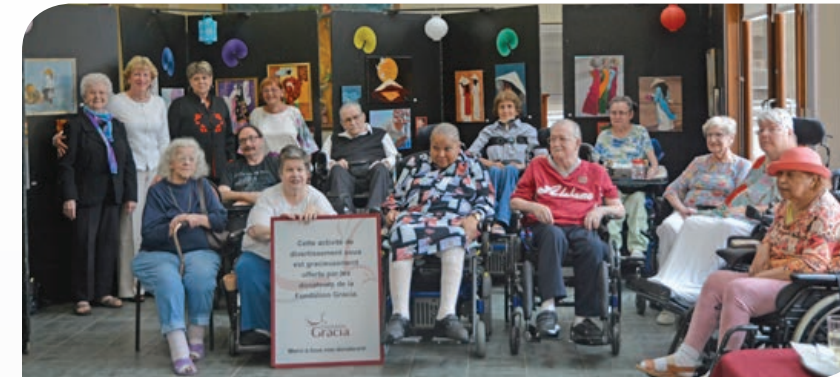
◀ Les résidents artistes-peintres du Centre d'hébergement Notre-Dame-de-la-Merci.